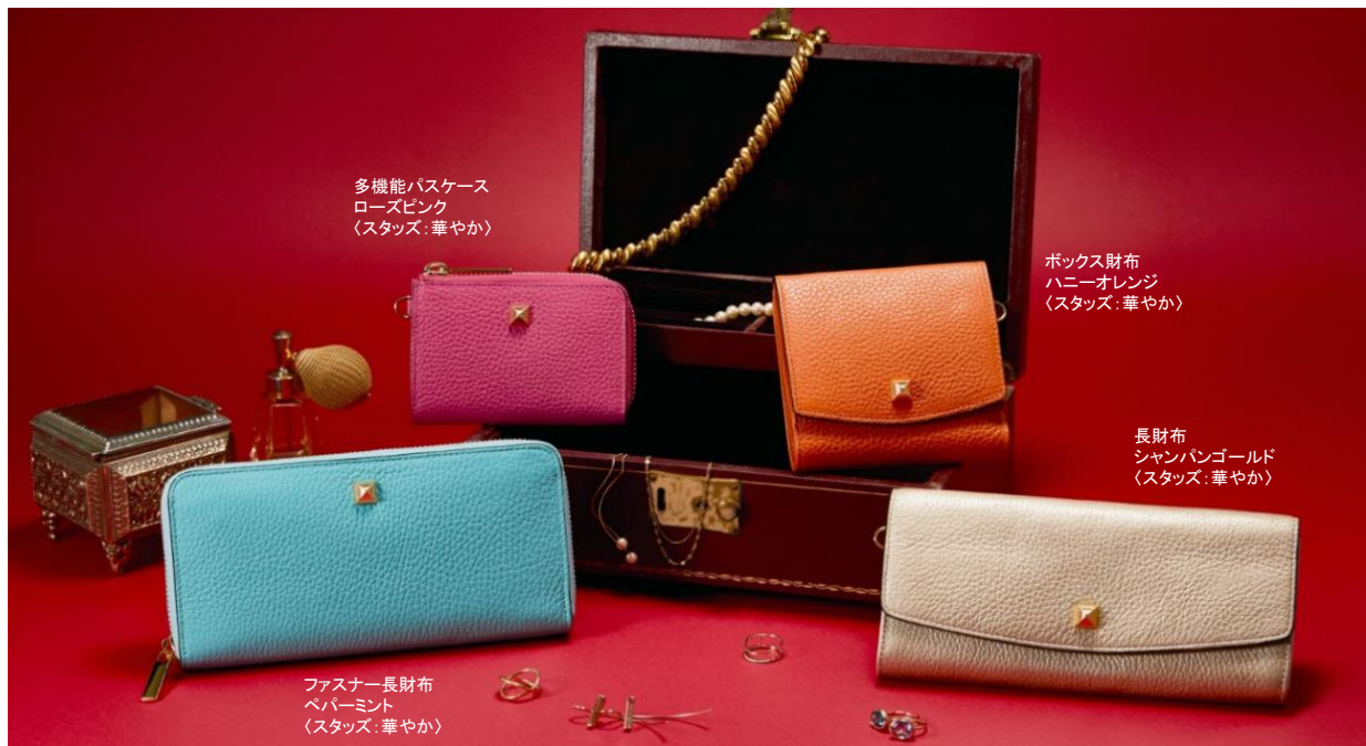
多機能パスケース ローズピンク (スタッズ: 華やか)

「オーダーメイドは高価」という一般的な概念を覆すアテナのオーダーメイド。「型」や「色」を選んでいくだけの簡単ステップで、既製品では成し得ない多彩な種類から自分だけの一品が選べます。注文を受けた分だけをまとめて生産することで無駄をなくし、徹底的にコストを削減。企業理念をまさに体現したアテナのオーダーメイドです。