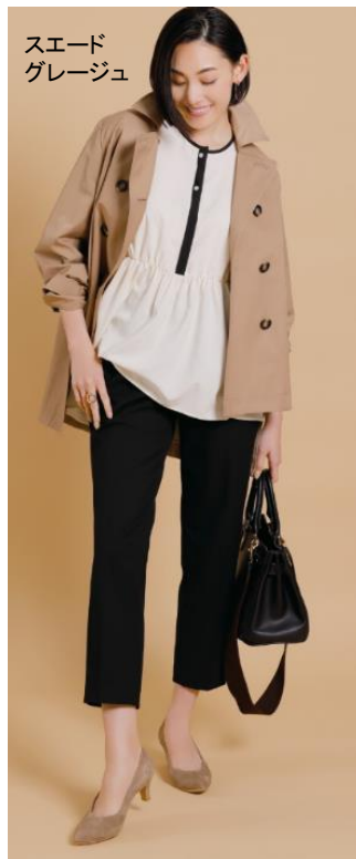
スエード グレージュ