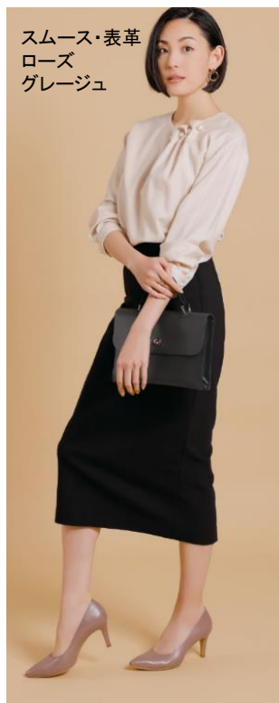
スムーズ・表革 ローズ グレージュ

大人女性の様々なライフスタイルやファッションに寄り添えるヒール高3種のラインナップ。フラットシューズよりも歩きやすく美しい「3.5cmヒール」に、履き心地と美しさのバランスで圧倒的人気を誇る「5.5cmヒール」、ハイヒールとは思えない安定感のある履き心地を実現した「7.5cmヒール」を販売中。