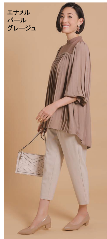
エナメル パール グレージュ