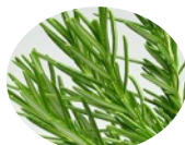
ローズマリー葉エキス