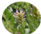
グリチルリチン酸2K

*4 スカルプハーブス…抗炎症効果やリラックス・鎮静効果のあるハーブを厳選ブレンドした5種のハーブエッセンスが、カラーリング後の荒れた地肌環境を健やかに整え、繰り返すヘアカラーに負けない健やかな髪と地肌を育みます。