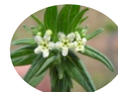
ムラサキ根エキス