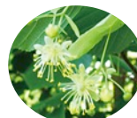
フユボダイジュ花エキス