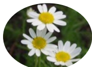
カミツレ花エキス