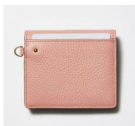
背面ポケット付き

内側には4つのカードポケットを設け、札入れ内側のカードポケット2つと背面のカードポケット1つを合わせると、計7枚ものカードを収納できます。