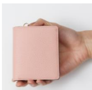
手にすっぽり収まるサイズ