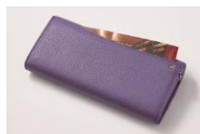
背面ポケット付き