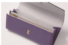
2つのスナップボタン

アテナア財布の中で一番の大容量で、小銭や紙幣以外にチケットやレシート類も仕分けして収納できます。