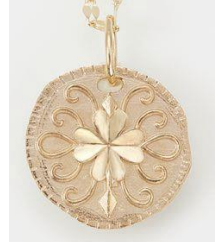
<裏> クローバー・鍵