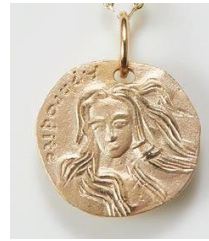
<表> 女神アフロディーテ

すべての運の基本となる人間関係を良好に導くモチーフ。 プライベートにおいて愛情溢れる日々をもたらす、 愛と美の「女神アフロディーテ」を表に刻印。 裏には富と幸運の神ヘルメスのサンダルにある「翼」と 幸運を授ける「五芒星」、縁を結びリボンの3つをデザイン。