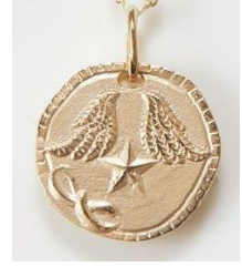
<裏> 翼・五芒星・リボン