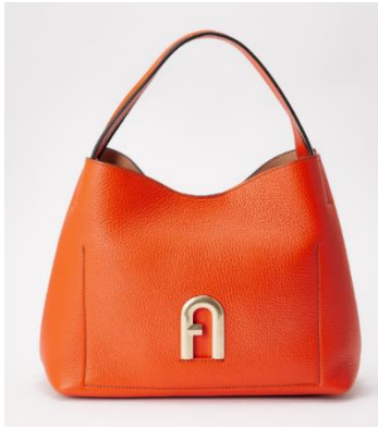
フルラ レザーバッグ 『PRIMULA S HOBO』 <タンジェリン> 価格：63,800円(税込)

新しい日常にこそ持ちたい、フルラの新作レザーバッグは、軽さと使いやすさを兼ね備え、大人女性の日常にマルチに寄り添います。また、アテナアだけでしか手に入らない、色鮮やかな<タンジェリン>カラーは、持つだけで日常のファッションを洗練された印象へと格上げします。