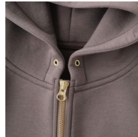
フードの襟もとにはゴールドのハトメをつけておしゃれのアクセントに。