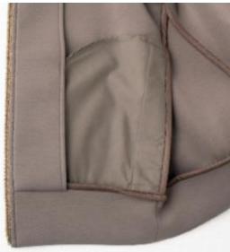
サイドポケットの裏地は薄手の生地で作ってふくらまない設計に。

また、お腹まわりやヒップなどの肉付きが気になる部分は前後差のある丈がさりげなくカバーし、すっきり演出します。