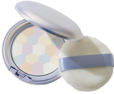
〈計算された5色のパウダー〉

見た目も可愛い5色の計算されたパウダーで涼感を高めるフェイスパウダー。クリアな肌を一日中キープ。ミントブルーやラベンダーなど寒色カラーがくすみを飛ばし、夏肌に透明感をプラスする「フrostベールパウダー」。汗や皮脂によるくすれを防ぎ、さらりと快適な毛穴レスな肌が一日中持続。紫外線対策はもちろん、スキンケア成分配合で肌荒れを防ぐ。