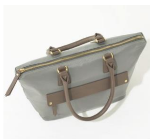
【開口部ファスナー】