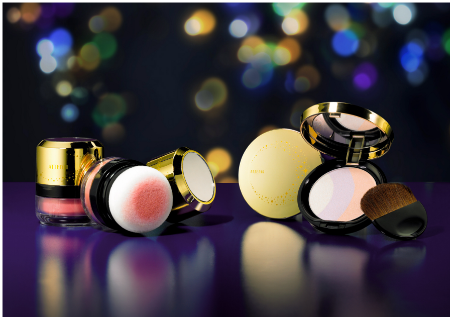
写真左:ムーンライトクチュール パフチーク

アテナアは、洗練された大人の女性にふさわしい上品さのある華やかな艶メイクを叶える、2013冬限定メイク2品『ムーンライトクチュール フェイスパウダー』2,400円(税込)と、『ムーンライトクチュール パフチーク』1,800円(税込)を、2013年11月18日数量限定発売します。“Moonlight Pearly Dress Up”。月明かりに映える真珠のように、上品な輝き。気品を極めた真珠肌へ導きます。