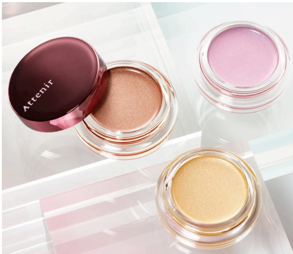
写真左から(ハニーブラウン・イエローゴールド・モーブピンク)

パールが陰影をつくるため、1色で上質な濡れ艶と自然な立体感を演出。目もと全方位、どこから見ても上品な輝きを放つ新感覚のジェル状アイカラーの登場です。うるおいのあるジェルがまぶたにしっかりピタッ！とフィットして、つけたての色が長時間続きます。さらに、メイクライン共通の「隠しピンク設計」*1により、大人のメイク悩み“くすみ”を取り払い、肌映えのする美しい仕上がりになります。